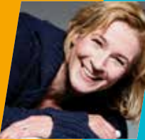
CLAUDIA PECHSTEIN Wahlkreis 84 (Treptow-Köpenick)