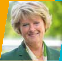
PROF. MONIKA GRÜTTERS Wahlkreis 85 (Reinickendorf)